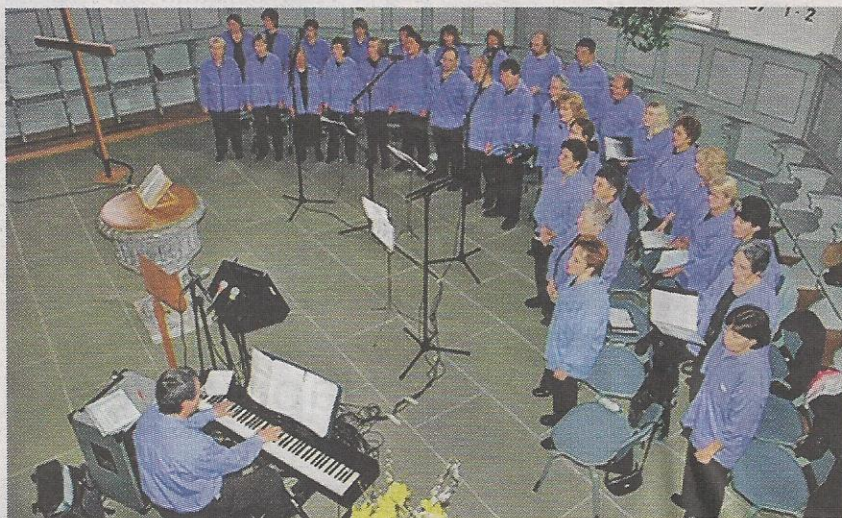
«The Gospel Singers Madiswil» bei der Probe.